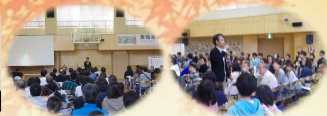
熱気に溢れる会場の様子