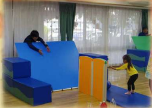
バンクボーリング