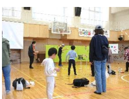
もりちゃんのけん玉ショー&検定