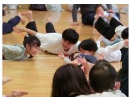
みんないい表情をしていますね