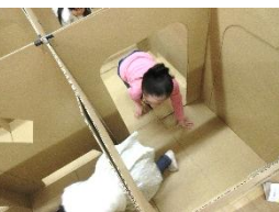
段ボールめいろも満員御礼でした