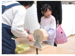
ガラポン 当たりのカランカランが響きました