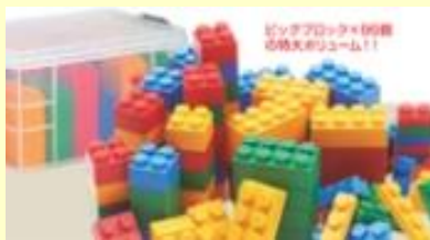
BIGサイズのやわらかブロック