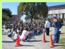
短時間で避難終了