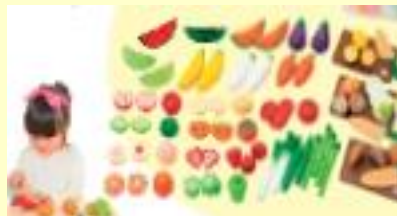
おままごとシリーズ(野菜と果物)