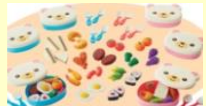
くまさんのお弁当シリーズ