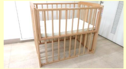
眠くなったお子様はこちらへ