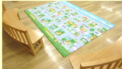
やわらかい はいはいマット

今まで以上に楽しい時間を過ごしていただけるよう、バージョンアップしたおもちゃ等を導入しました。