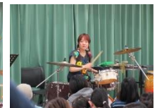
パーカッション あゆみ先生