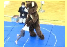
昨年の様子（こいのぼりめぐり/くまさんすもう）