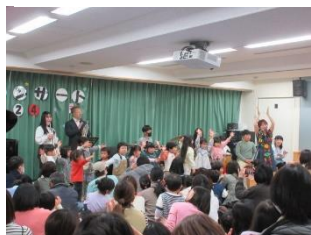
手遊びで参加した子どもたちも大喜び