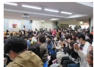
熱気に包まれた会場