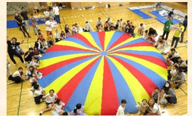
パラバルーンを終えて、はいチーズ!

じつは、この催し物に参加したある保護者が、次のように話してくれました。「昔の遊びって、ニコニコしちゃうんですね」じつは、こどもの国職員も同じことを感じていました。スマホゲームなどの面白さとはまったく違うのです。よく見ていると、参加している子ども以上に保護者がニコニコしているのです。親子が一つになって、喜びを共有しているように感じられました。