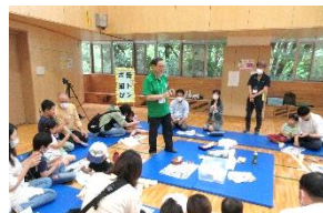
紙とんぼコーナー