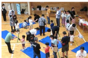
こままわしコーナー