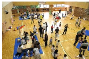
軽体育室全体の様子